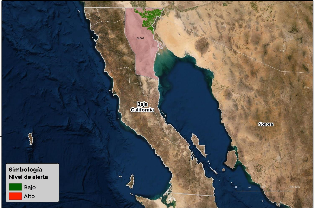
Municipios con cultivo y probable riesgo por Roya de la hoja de trigo en Baja California

GEOMÁTICA-D3-SENASICA © 2022 DAHF FECHA: 07-MARZO-2022