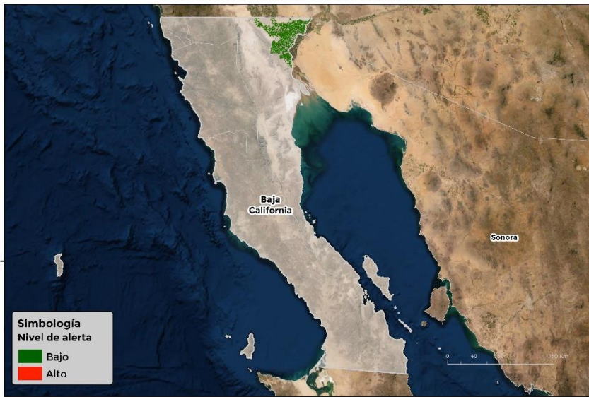
Nivel de alerta por Roya de la hoja de trigo en Baja California

Se identifica que la Roya de la hoja del trigo puede iniciar su proceso de infección debido a que existen condiciones favorables en 1 municipio en riesgo fitosanitario bajo (Anexo 1).